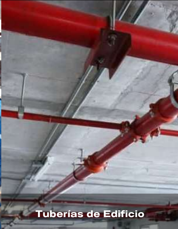
Tuberías de Edificio