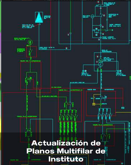
Actualización de Planos Multifilar de Instituto