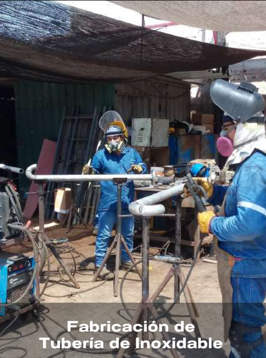
Fabricación de Tubería de Inoxidable