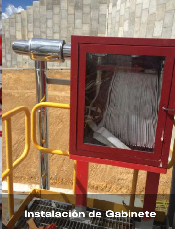
Instalación de Gabinete