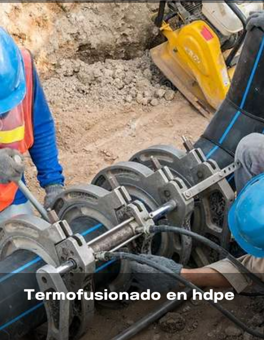
Termofusionado en hdpe